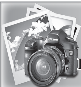
ФОТО НА ДОКУМЕНТЫ от 300 руб. ПЕЧАТЬ ФОТОГРАФИЙ от 15 руб./шт.

Адрес редакции «Невский исток»: ул. Жука, дом 5. Телефон: 74-352.