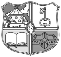
Шлиссельбургская городская библиотека им. поэта М. А. Дудина