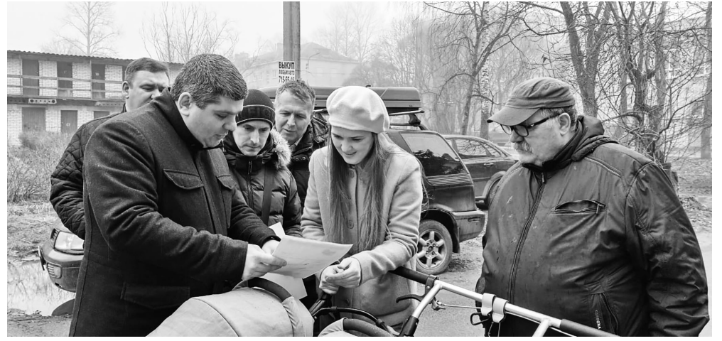
городская среда» будет благоустроен двор дома №3 по ул. 18 января.

Отметим, что также в этом году в Шлиссельбурге в рамках проекта «Комфортная