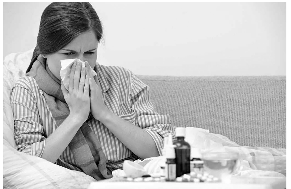
По инф. Роспотребнадзора